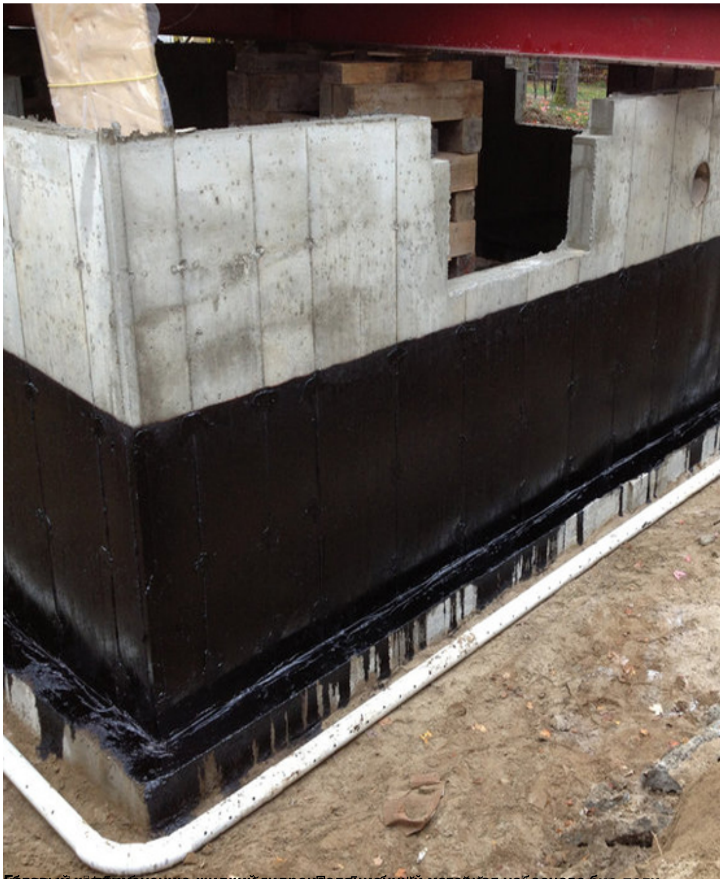
Берилісін гидропластикпен қамқу және дренажді қамқу және біріктірілісін